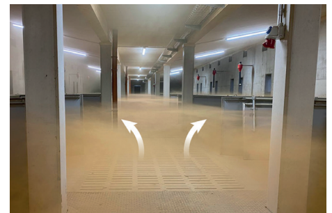
Gekühlte Frischluft strömt ohne Zugluft in den Liegebereich

Ein gutes Stallklima ohne Zugluft und mit angenehmen Temperaturen, tragen zu sauberen Buchten und gesunden Schweinen und Landwirten bei. Die unterflur geführte Frischluft wird im Winter durch den Erdboden erwärmt und im Sommer gekühlt. An besonders heissen Tagen kann die Luft zusätzlich mit einem Coolpad gekühlt werden.