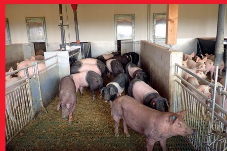
Aussenklimabereich mit Fütterung und Schweinetoilette