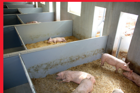
Eingestreuter und klimatisierter Liegebereich